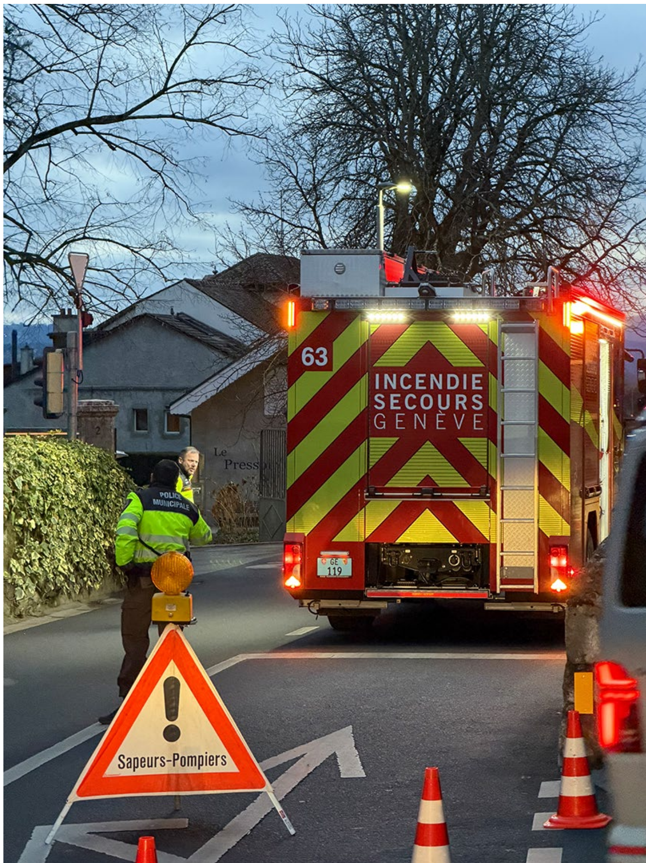
3_Espace Fontaines sécurisation routière par la police municipale