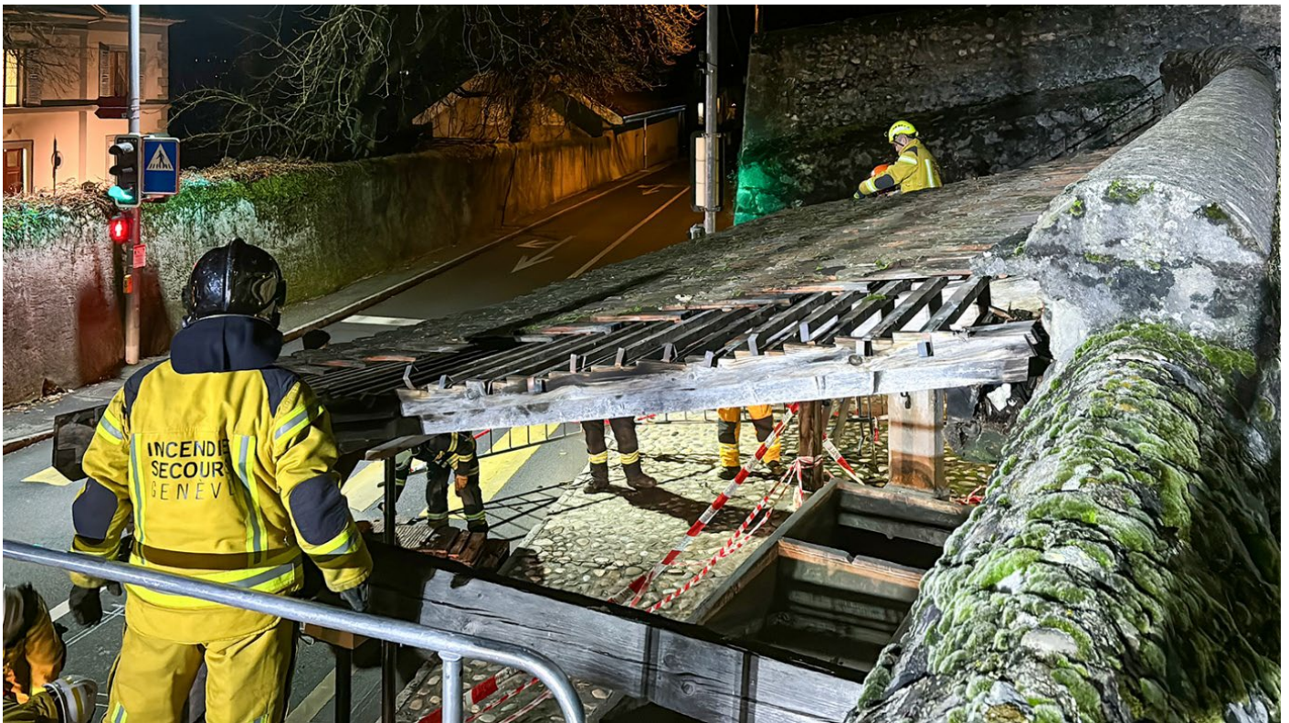
5_Espace Fontaine démontage du toit et de la structure