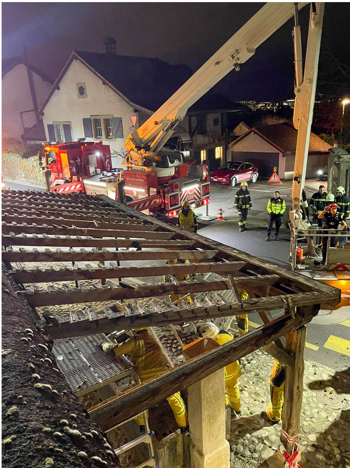
6_Espace Fontaine démontage du toit et de la structure