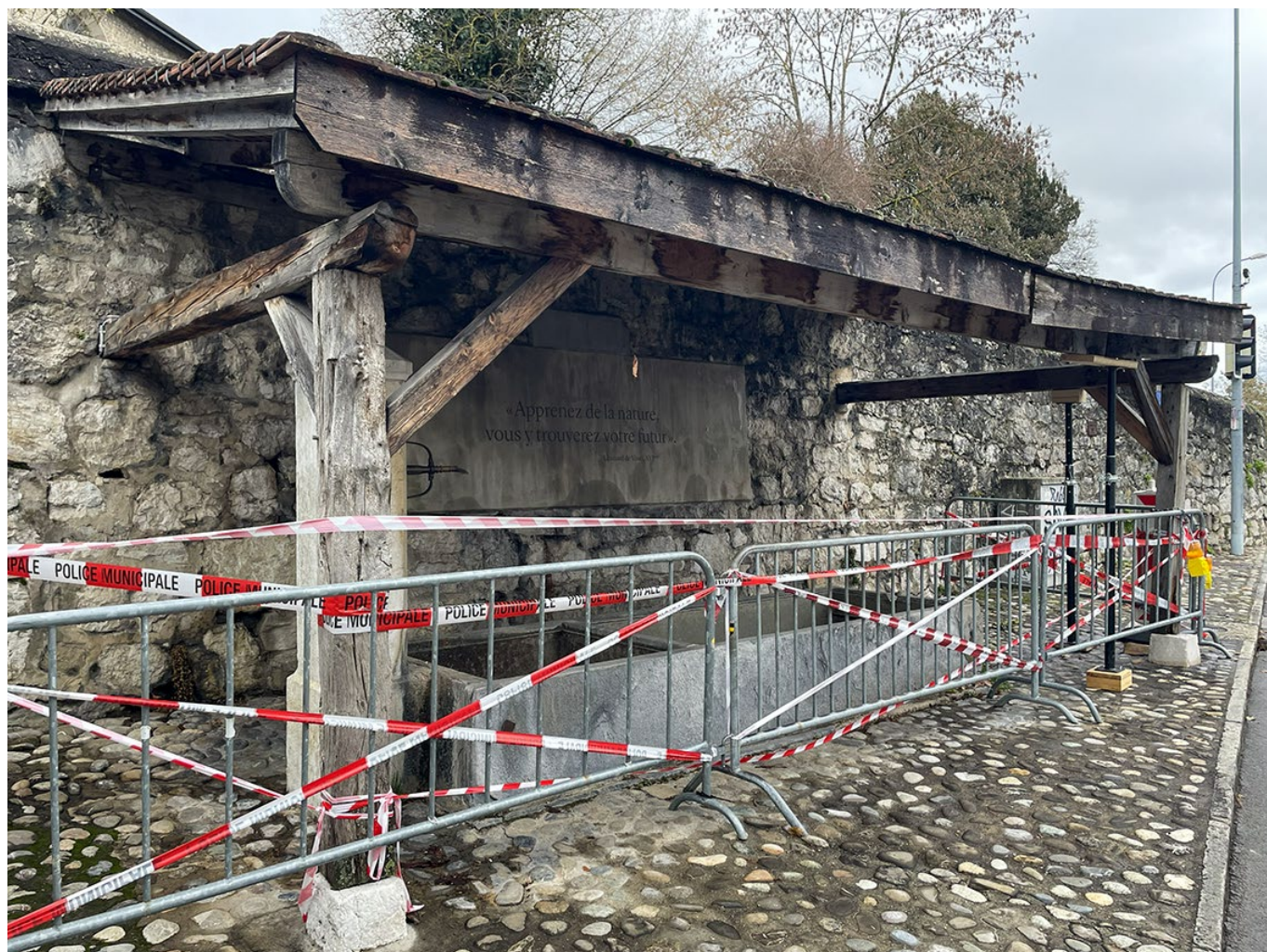
1_Espace Fontaine sécurisé avant intervention