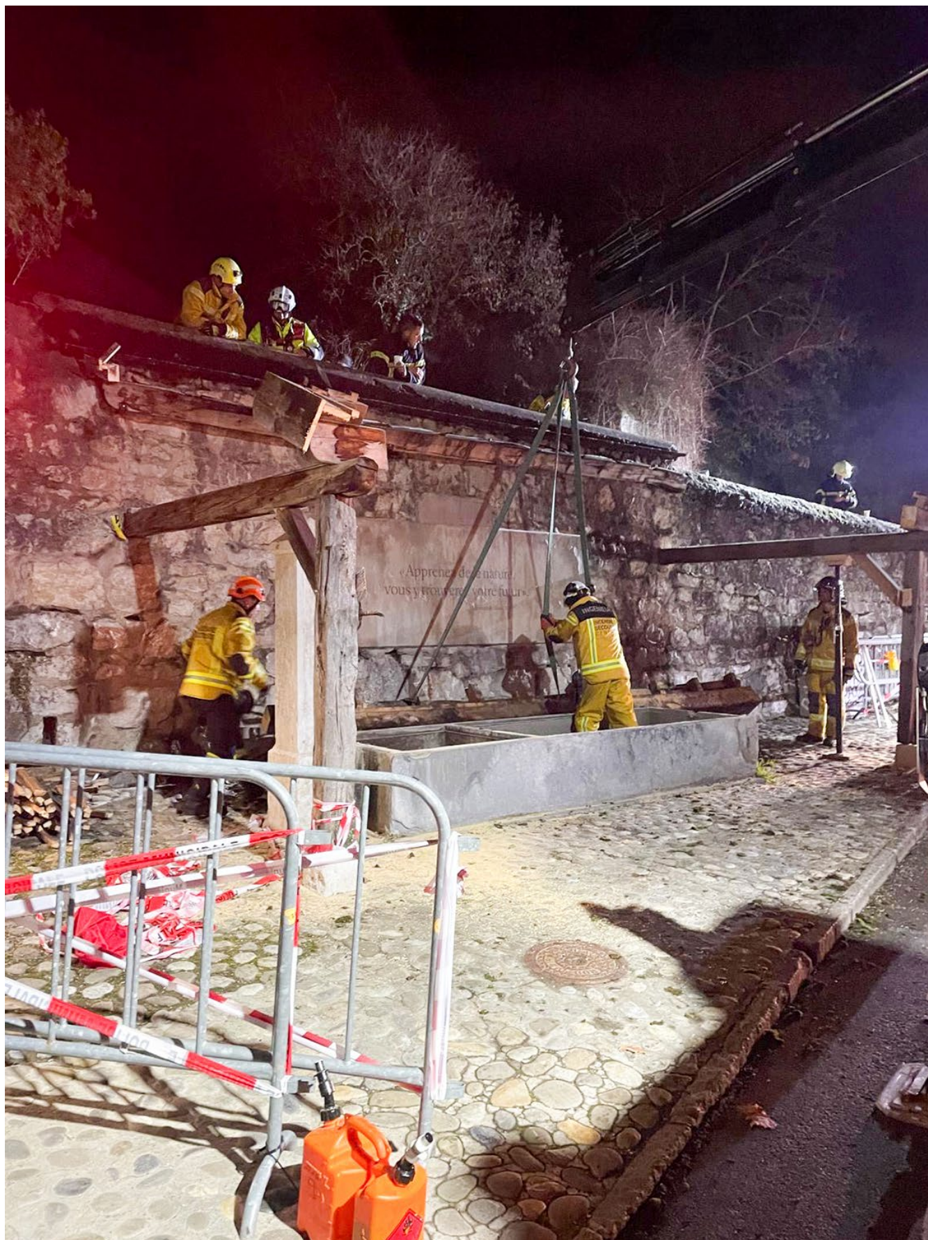
9_Espace Fontaine démontage final de la structure