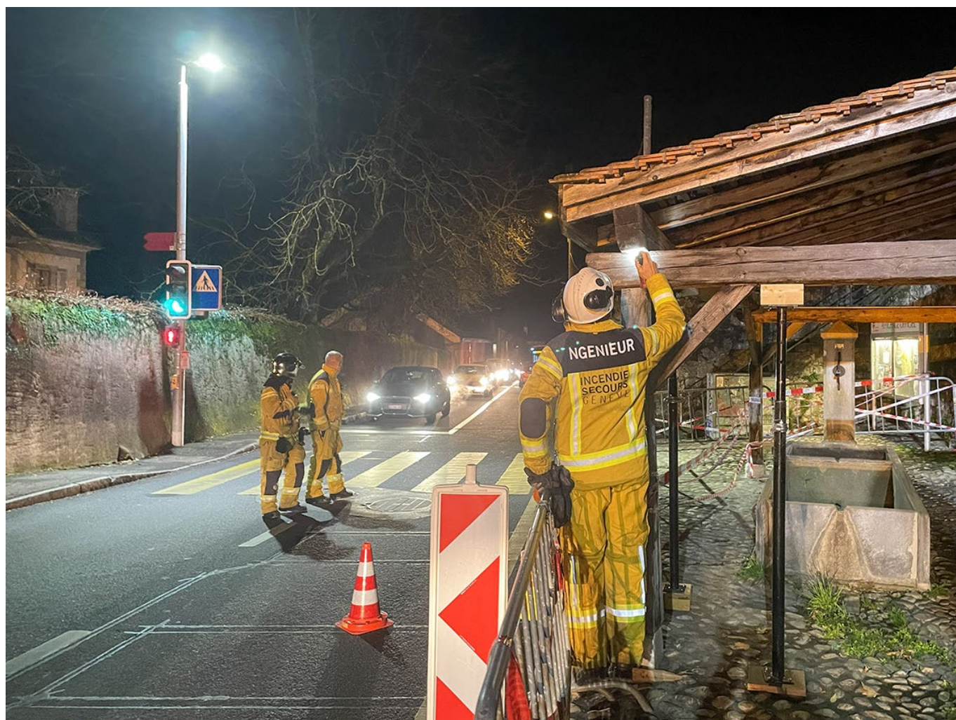
2_Espace Fontaines constat par l'ingénieur SIS