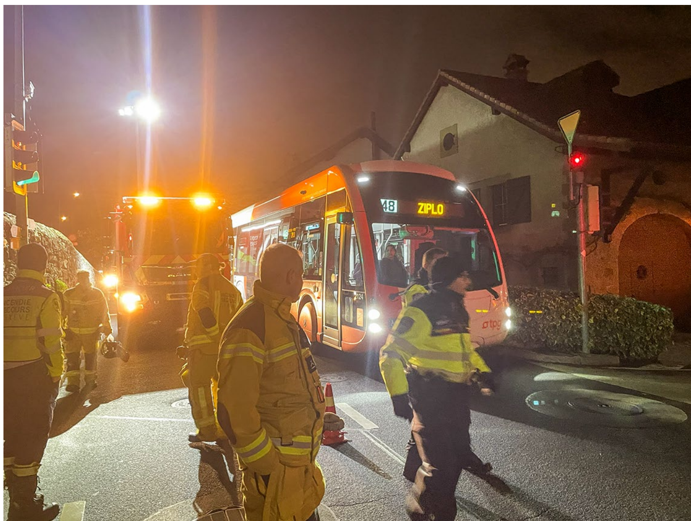
8_Espace Fontaine gestion de la circulation et des bus TPG