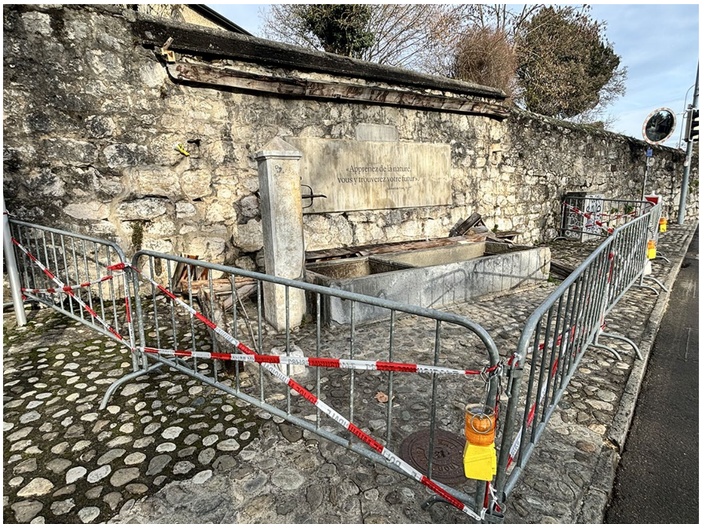
10_Espace Fontaine le jour après l'intervention