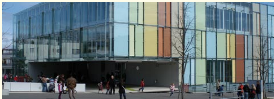
Les verrières de l'école de Cressy