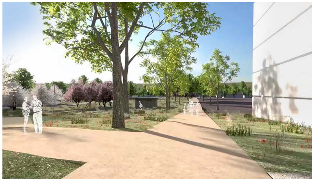
Image extraite de la simulation 3D du quartier de Vuillonex (2019)

Un plan de mobilité est à l'étude afin de renforcer la mobilité douce, sécuriser les cheminements, faciliter l'accès aux transports publics et relier les différents sites communaux. La zone 30 sera également étendue au secteur des Marais. S'agissant du tram 15, les oppositions ont été levées et les travaux devraient commencer en 2021.