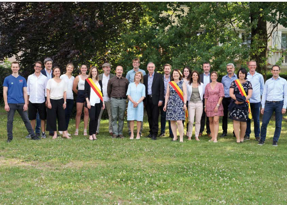
Nos élu-e-s au Conseil administratif et au Conseil municipal de la nouvelle législature 2020-2025