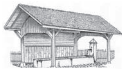
Mémoire de Confignon

Sommes à la recherche de tous documents ou objets concernant l'histoire de Confignon.